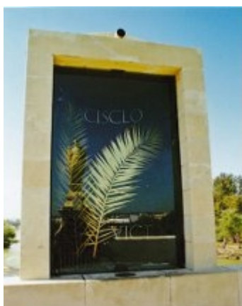
Patrons with the Protector.